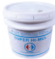
Ciment haute température