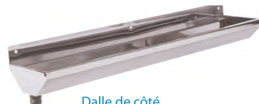
Dalle de côté