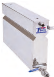
Panne à eau