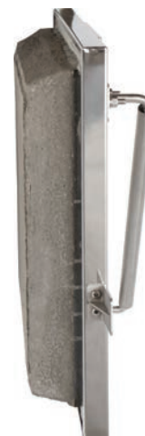
Porte étanche avec ciment réfractaire